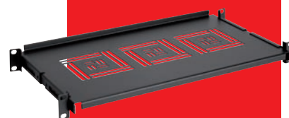
Police pevná 1U pro uchycení ve 4 bodech