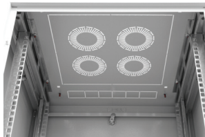
Pohled na strop - šířka 600 mm

Ke skříně je možné přibjednat velké množství standardního 19" příslušenství, jako jsou police, záslepky, vyvazovací panely a mnoho dalších včetně speciálního příslušenství na přání zákazníka.