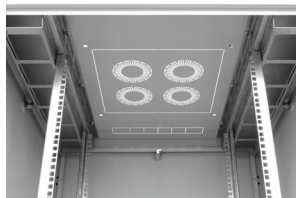
Pohled na strop - šířka 800 mm